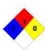
Identificación de riesgos de materiales según NCh 1411

Clasificación de peligrosidad NCh 382 of.98