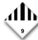
Productos misceláneos Clase 9