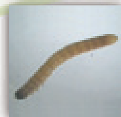
Gusano alambre