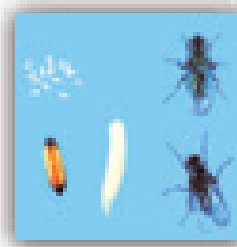
Mosca de la semilla