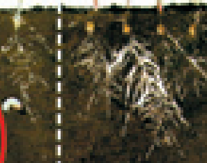
Semillas de maíz tratadas con FORCE