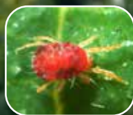
Arañita roja de los cítricos