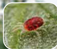
Arañita roja europea