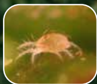
Falsa araña de la vid